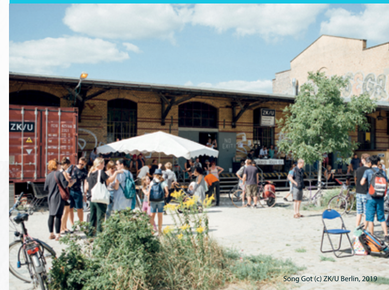
Song Got